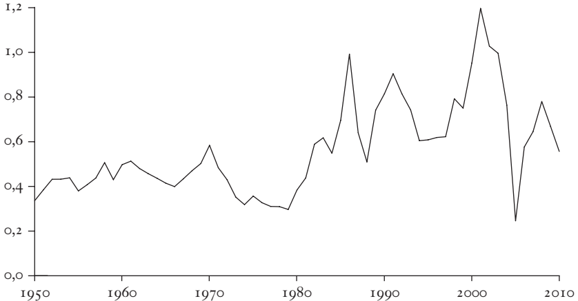
Diagram 3. Utdelningar till aktieägare delat med vinster efter skatt 1950–2010

Källa: Federal Reserve Statistical Release.